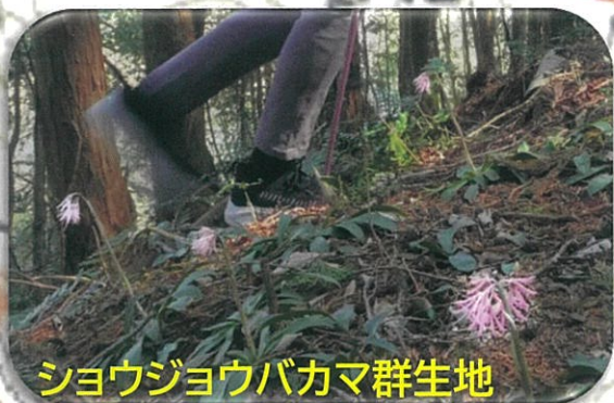
ショウジョウバカマ群生地